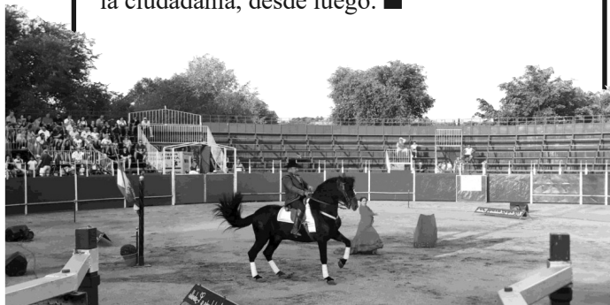
Poquísimos vecinos han acudido a los festejos taurinos. ¿Por qué subvencionar espectáculos sin interés cuando hay tantas carencias en el pueblo?

El resultado de estos festejos ha sido el previsible: dos tercios de la plaza vacíos y la mayoría de los escasos espectadores, llegados de otros municipios. A Colmenarejo no le interesan los toros , hay necesidades mucho más importantes. Pero alguien está empeñado en mantener a toda costa esta polémica y bárbara tradición; alguien que no es la ciudadanía, desde luego. ■